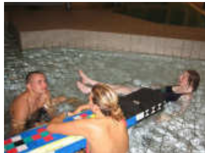
Vi var først gang på Bagsværd svømmehal. Stor succes. Tidspunktet var lidt sent. Men så havde vi hallen for kun os selv. Alle nød vandet og var rigtige vandhunde. ☺