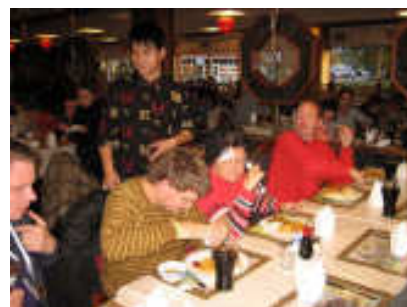
Vi besøgte en kinesisk restaurant i Herlev. Et godt sted med fin mad. Vi nød maden. ☺