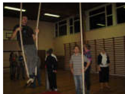
På Mørkehøj Skole trænede vi med forskellige at gymnastiklege som vi plejer. ☺