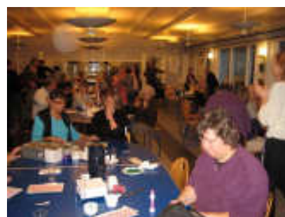
Vi har en fast tradition med banko hvert år. Nogle var så heldige med at vinde præmier. Andre var så uheldige med ingenting. Sådan er banko. Vi hyggede os fint i kantinen med mange gæster både fra Oktobervej og udefra. ☺