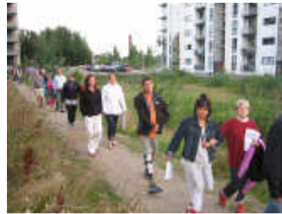
Vi gik en anden gåtur i naturen ved gl. TV-byen og kiggede på mange nye bygninger. ☺